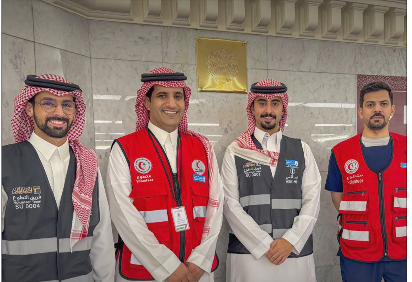
مشاركة فريق جامعة الملك سعود للعمل التطوعي في مكة المكرمة خلال شهر رمضان

كثيراً ما نسمعهم يقولون: ما عندك إلا الضعوي أي ما عندك إلا الجوع وفي سياقات أخرى ما عندك شيء يفيد . و"الضعوي" في الأصل اسم شعيب في منطقة القصيم ما فيه شيء سوى الذئب الجائعة - والمثل يراد به "البُر" الذي لا شيء فيه غير الذئب الذي يعوي من شدة الجوع. وتكثر في هذا الوادي شجر الضعة وهو شوك لا يسمن ولا يغني من جوع فقد ورد في القاموس المحيط "ضَعَا": ضَعَا: شَجَرٌ، (شوك) والنسبة: ضَعُوِيٌّ. فالكلمة عربية صحيحة رغم شيوعها على ألسنة العامة كما هو واضح في المثل: "ما عندك إلا الضعوي".