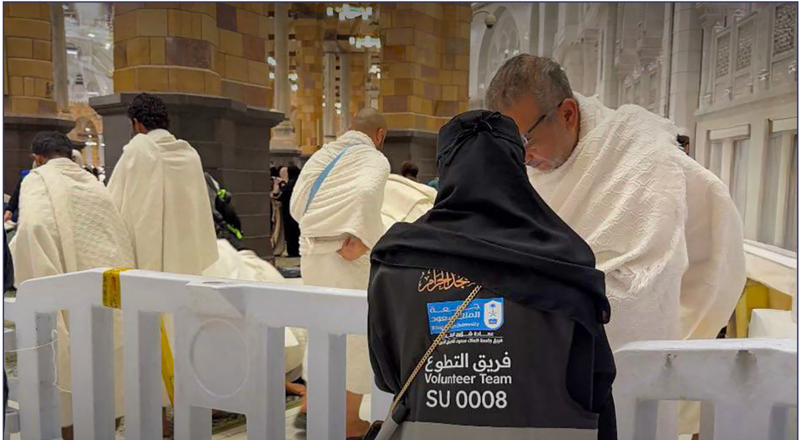
جانب من مشاركة فريق جامعة الملك سعود للعمل التطوعي في مكة المكرمة خلال شهر رمضان

الموضوعات المنشورة تعبر عن كتابها ولا تعبر بالضرورة عن رأي الجامعة أو الصحيفة