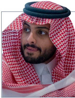
مشاريع بارزة في الجنوب

الفخامة والتراث . - مدينة جازان الاقتصادية: مشروع صناعي ضخم يسعى لتحويل جازان إلى مركز اقتصادي ولوجستي مهم على البحر الأحمر . - مشاريع البنية التحتية: توسعة المطارات، وتحسين الطرق، وتطوير الخدمات، مما عزز من ارتباط الجنوب ببقية مناطق المملكة . هذه المشاريع ليست منفصلة، بل جزء من منظومة ضخمة تهدف إلى تحسين جودة الحياة وجذب الاستثمارات وتوفير فرص العمل . البعد التاريخي... روح المكان لا تتغير ورغبتنا هذا التطور، بقي الجنوب محتفظاً بروحه الأصيلة. فالقلاع الحجرية، والأسواق الشعبية، والعادات