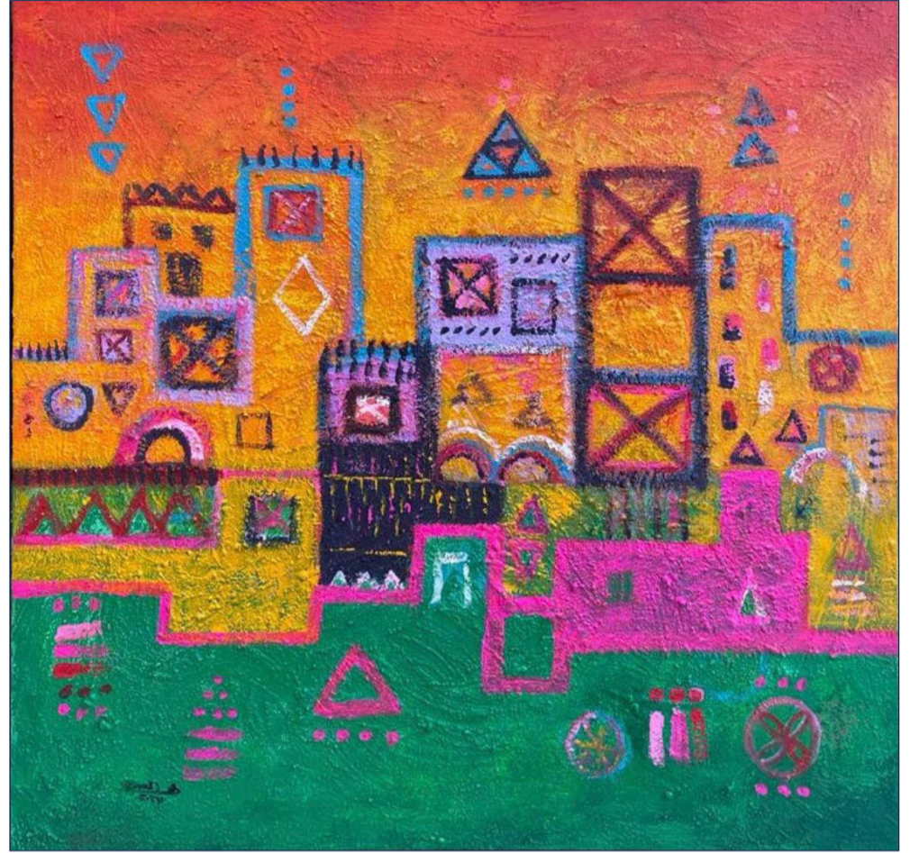
تراث ألوان أكريكال وخامات أخرى على كanvas 100*100 سم 2025 م

والتصميم الجرافيكي والإعلان، مما يوجد فرص عمل جديدة ويساهم في النمو الاقتصادي. فمن خلال البحث العلمي، يتمكن الفنانون والمصممون من تطوير منتجات وخدمات إبداعية ذات قيمة اقتصادية عالية، مما يساهم في تعزيز النمو الاقتصادي. وفي الختام، يتضح أن البحث العلمي يمثل ضرورة منهجية لتطوير الفنون البصرية والارتقاء بها، كما يمثل أيضًا عنصرًا أساسيًا لتطوير الفنون البصرية، حيث يساهم في إثراء المعرفة الفنية وتعميق الفهم وتطوير التقنيات والأساليب الفنية، وفهم العلاقة بين الفن والمجتمع وتعزيز الهوية الثقافية، والحفاظ على التراث الثقافي، ودعم الاقتصاد الإبداعي. ومن خلال ما سبق يجب على المؤسسات التعليمية والبحثية دعم البحث العلمي في الفنون البصرية وتشجيع الفنانين والباحثين بالاهتمام في هذا المجال بما يخدم تطوير الفن والمجتمع على حدٍ سواء.