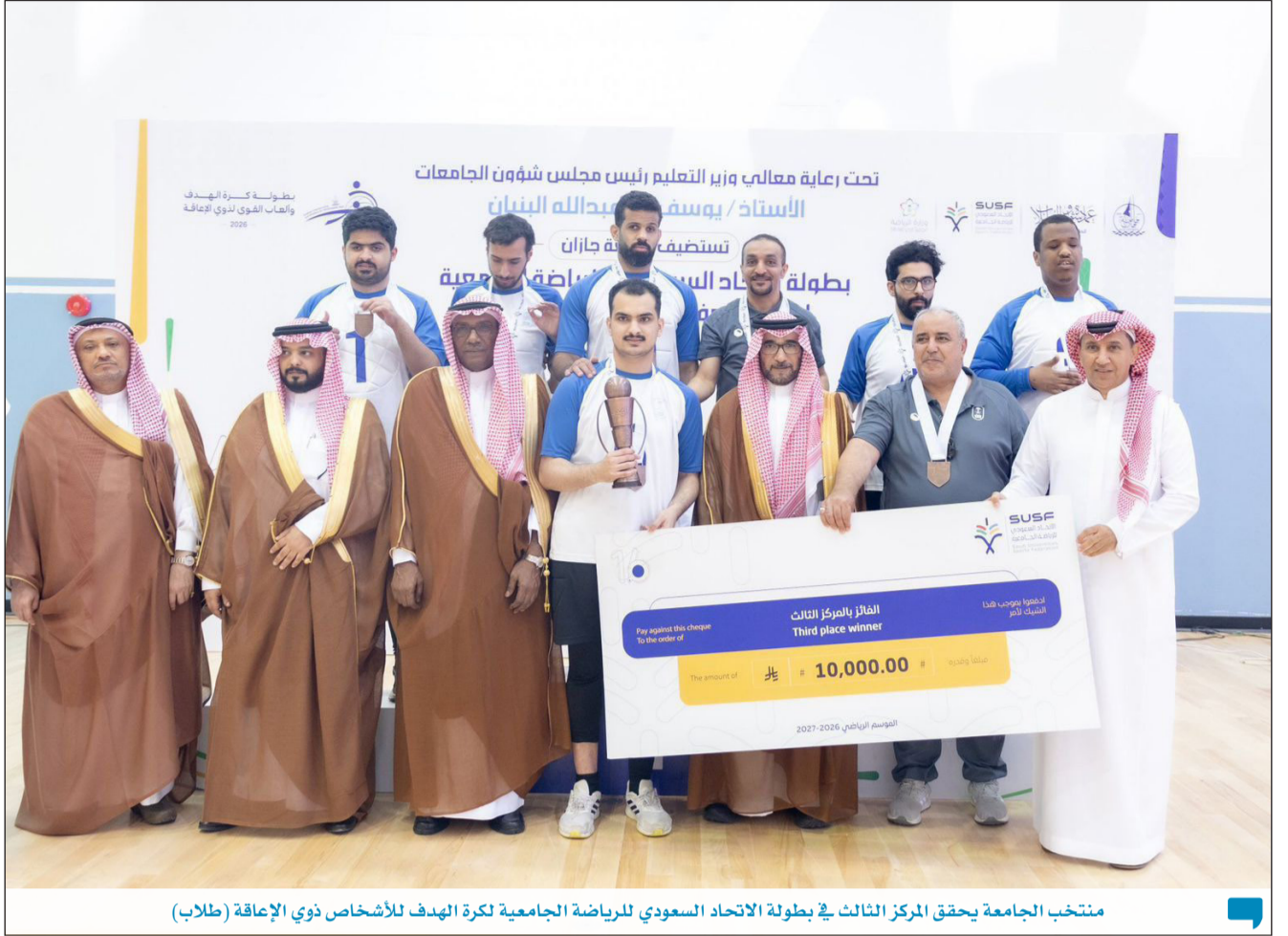
منتخب الجامعة يحقق المركز الثالث في بطولة الاتحاد السعودي للرياضة الجامعية لكرة الهدف للأشخاص ذوي الإعاقة (طلاب)

يشيع في الإعلانات التجارية استعمال كلمة (حَصَم) عند الإعلام عن تخفيض سعر سلعة معينة؛ إذ يقال مثلاً: هناك حَصَمٌ خاص يصل إلى كذا وكذا، وهذا غير صحيح؛ لأنَّ الحَصَم هو العدوُّ المخاصم، والصواب أن يقال: هناك حَسَمٌ خاص يصل إلى كذا وكذا، أو تخفيض؛ لأنَّ الحسم يعني قطع الشيء أو إزالته أي تخفيض السعر؛ لأنَّ القطع والإزالة حذف، وهو الذي يناسب هذا المقام - كما في المعجم اللغويّ، فهكذا نطقت العرب فصي المعجم الوسيط معانٍ معجميّة تدلّ بشكل أو بآخر: على القطع والإزالة والمنع وجميعها يدلّ على أنقص الشيء أو الأخذ منه؛ إذ ورد فيه: حَسَمَ الشيءَ قطعَهُ، ويقال: حَسَمَ الداءَ: أزاله بالدواءِ وحَسَمَ العرقَ قطعَهُ وكوّاه لئلا يسيل دمه، وحَسَمَ عنه الأمرُ أبعدَهُ وحَسَمَ على فلانٍ غرضه: منعه من الوصول إليه، وحَسَمَتِ الأمُ طفلها: منعتهُ من الرضاع " في حين أنّ (الخصم) هو المخاصم والمنازع والمجادل - كما في المعجم اللغويّ؛ ففي المعجم الوسيط: "حَصَمَهُ حَصَمًا وَحَصَامًا وَحَصُومَةً: غلبَهُ في الخصام... وجادله، ونازعه... والخصم: المخاصم أي العدو - قال تعالى: "وَهَلْ أَتَاكَ نَبَأُ الْخَضَمِ إِذْ تَسَوَّرُوا الْمِحْرَابَ" سورة (ص)، آية (21) فكلمة (الخصم) في الآية لفظًا مفرد لكن يستوي فيه المفرد والمثنى والجمع والمذكر والمؤنث، وقد يثنى ويجمع، وجاء مثنى في قوله عز وجل: "هَذَانِ حَصِمَانِ اِخْتَصِمَا فِي رَيْبِهِمْ" سورة الحج، من الآية 19، والجمع (حَصُومٌ).