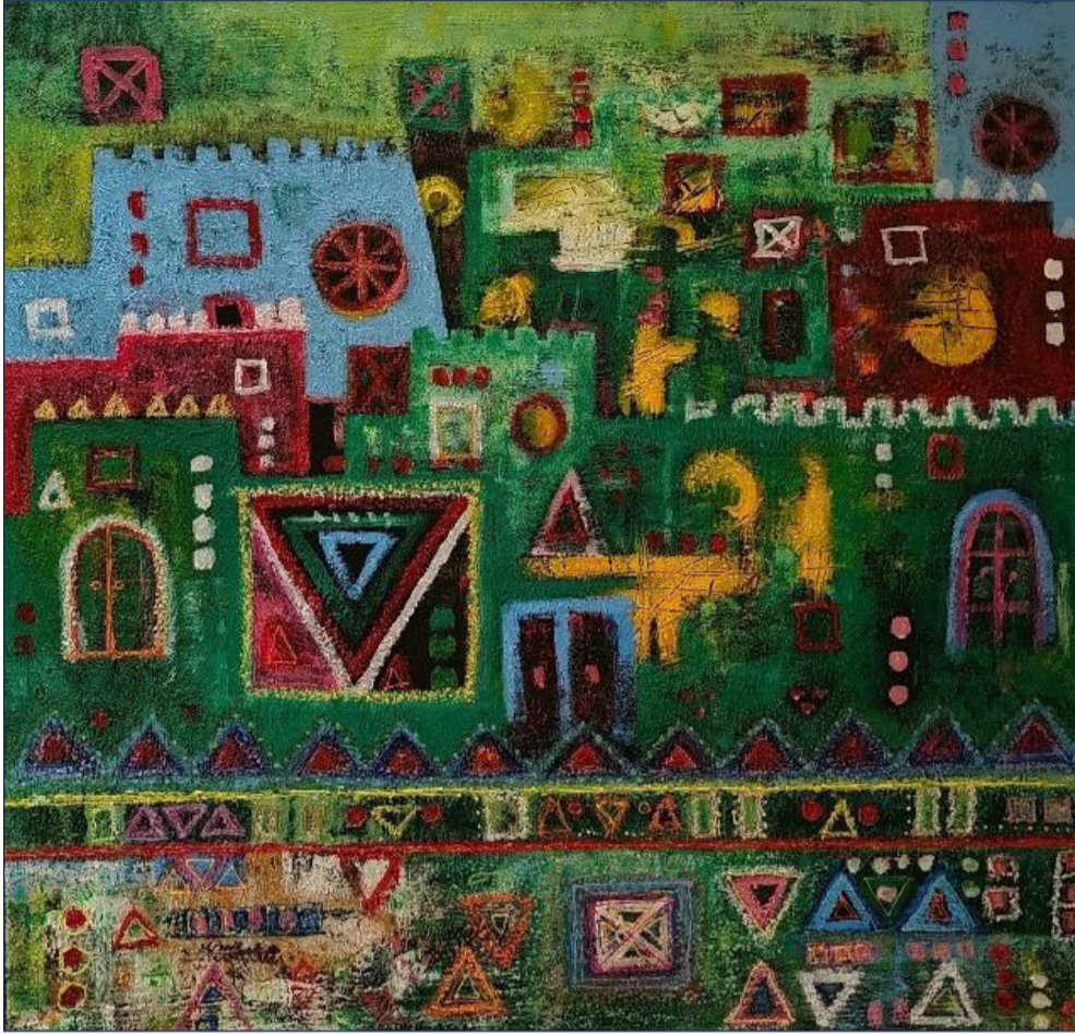
تراث ألوان أكريكال وخامات أخرى على كanvas 100*100 سم 2024 م