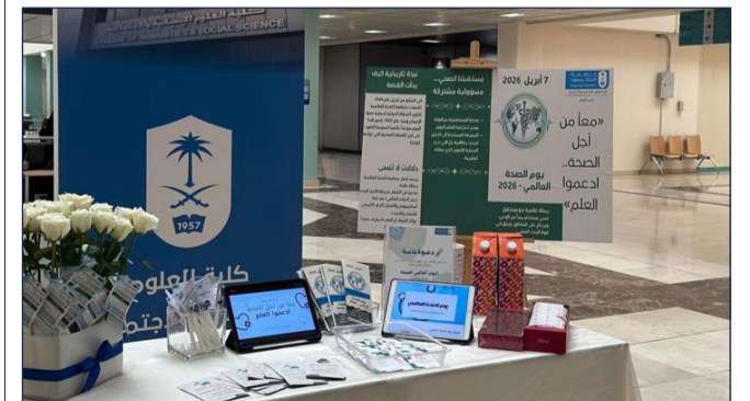
رسالة الجامعة أحلام أبوذياب

نظمت طالبات قسم الإعلام بإشراف د. بلقيس الجماعي مؤخرًا فعالية توعوية بمناسبة يوم الصحة العالمي لعام 2026 تحت شعار "مأ من أجل الصحة، ادعموا العلم" وذلك بهدف تعزيز الوعي الصحي وتبسيط الضوء على أهمية تعزيز الدور المجتمعي للإعلام في نشر الثقافة الصحية، وشهدت الفعالية على إقامة عدة أركان تفاعلية استعرضن من خلالها العديد من المواضيع التي تتعلق بنقل الشائعات الصحية عبر وسائل الإعلام ودور الإعلام في المنظمات الصحية في إيصال الرسائل الصحية للجمهور.